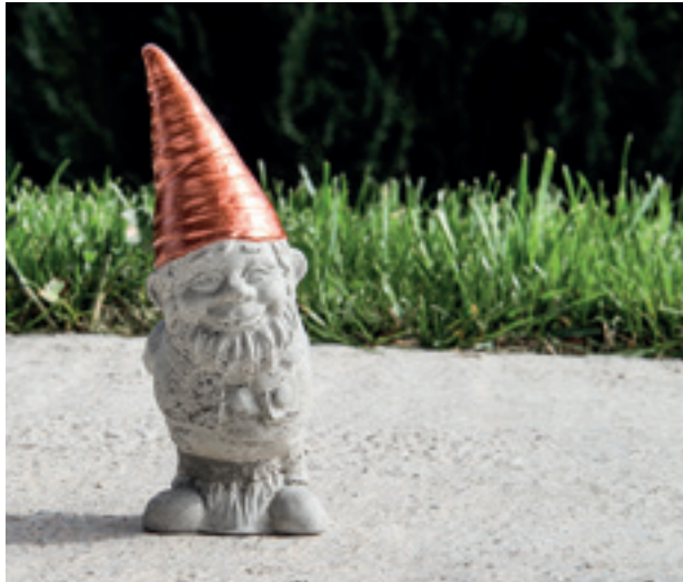
↑ Art. 34216000