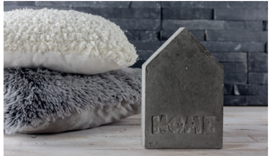
↑ Art. 62594000