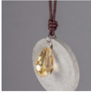
↑ Schmuck-Beton (z.B. 34 166 000)