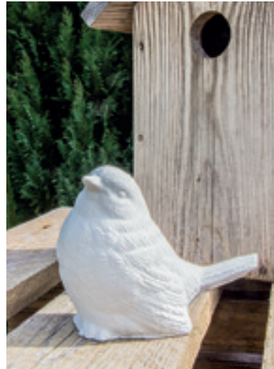
↑ Art. 34215000