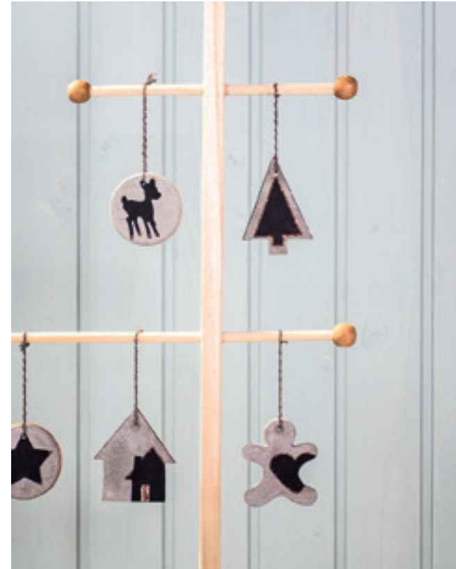
↑ Art. 62582000

Du kannst die Formen mit einer dünnen Schicht Kreativ-Beton füllen, für kleine, leichte Anhänger – oder komplett befüllen, um diese als Aufsteller zu benutzen.