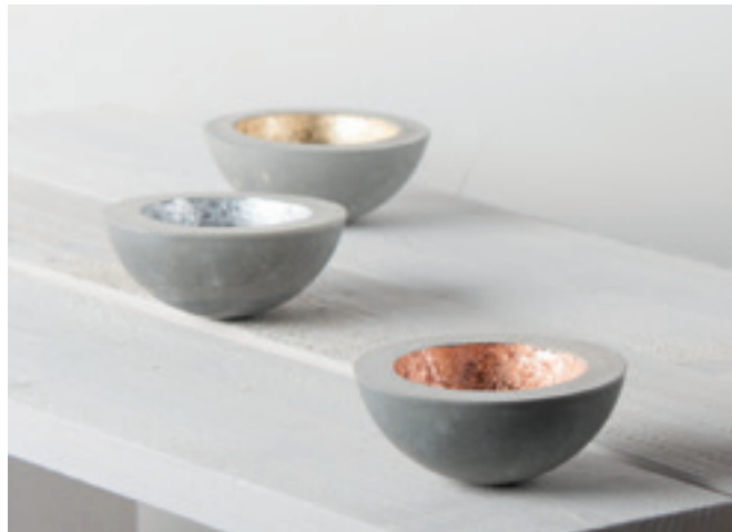
↑ Art.3906437 + 3906537