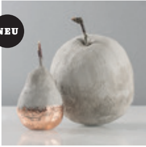
↑ Kreativ-Knetbeton (z.B. 34 211 000)