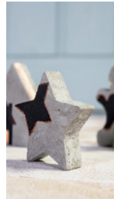
↑ Art. 38887000